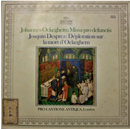
Abbildung 3: Cover der LP Archiv Produktion 2533 145, 1973.

Poster. Zu diesem »empathischen« Verhältnis zur Alten Musik tragen nicht unwesentlich auch die materiellen Elemente der Medien bei. Bei dieser letzten Platte hat man Bilder in Farbe, was nun zum neuen Standard der Vermarktung von klassischer und eben auch Alter Musik wird (vgl. Abb. 2). Die Musikgeschichte verspricht damit ein anderes Erlebnis und eine andere Auffassung als diejenige der fünfziger Jahre. Das objektivierende Narrativ eines Komponisten, dessen Musik hauptsächlich auf den Seiten von Büchern und nicht als erklingende Musik existiert, wie bei Archiv Produktion , hält im Kontext der Popularisierung dieser Musik nicht mehr stand. Im Laufe der sechziger Jahre verlieren geschlossene, buchartige Reihen allmählich an Bedeutung. 47 Archiv selbst wird von einer Reihe zu einem Label: Die Organisation in »Forschungsbereichen« samt informativen Karteien wird Anfang der siebziger Jahre aufgegeben; selbst der Name wird einfach in Archiv Produktion gekürzt (der Untertitel »des Musikhistorischen Studios der Deutschen Grammophon Gesellschaft« wird endgültig abgeschafft). Als das Hören dieser Musik (zum Nachteil der enzyklopädischen Idee) zum Vergnügen wird, verliert auch das »archivalisch-wissenschaftliche« Layout seine ideologischen und soziokulturellen Voraussetzungen: Bei Archiv -Produktionen ver-