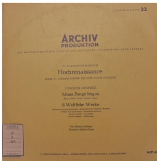
Abbildung 1: Cover der LP Archiv SAPM 198 171; ARC 73159.

Um Safford Capes Josquin-Aufnahme zu analysieren, fange ich nun absichtlich bei einer Beschreibung der Platte an. Archiv Produktion ist eine Schallplattenreihe der Deutsche Grammophon Gesellschaft , die Musik von der Gregorianik bis ungefähr 1750 anbietet. In der kompletten Fassung lautet ihr Name wie folgt: »Archiv Produktion des Musikhistorischen Studios der Deutschen Grammophon Gesellschaft«. Sie enthält Schallplatten, die in zwölf »Forschungsbereiche« unterteilt sind. Jede LP enthält eine Kartei mit Angaben zu den Interpret*innen, Ort und Datum der Aufnahme, der Besetzung, der Ausgabe der Musik und ihrer Herausgeber*innen usw. Josquins Messe und 8 weltliche Werke finden sich laut der Cover im, »IV. Forschungsbereich | Hochrenaissance | Serie A: Niederländer um und nach Josquin« (vgl. Abb. 1).