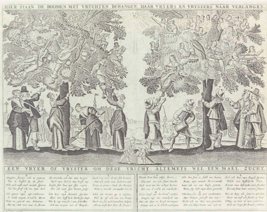
Abbildung 12: R. und J. Ottens, Vrijers en Vrystersboom , 3. Viertel 17. Jahrhundert

Hier stehen die Bäume mit Früchten, wonach Liebhaber sich sehnen und schmachten.