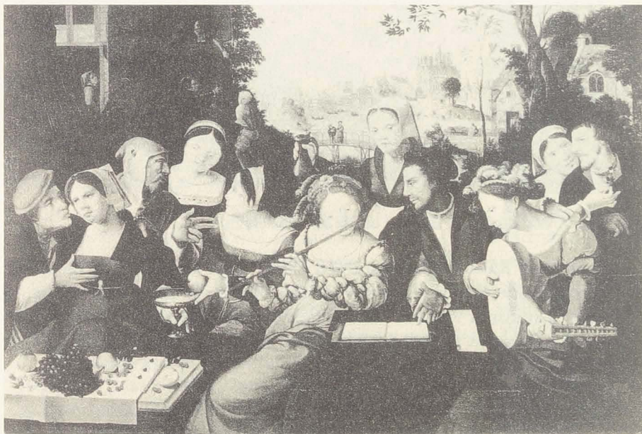
Abbildung 2: anonym (flämisch), Der verlorene Sohn ca. 1540/50

Zu Anfang des 16. Jahrhunderts entwickelt das Thema der ›lockeren‹ Gesellschaft sich größtenteils aus biblischen Motiven, vor allem Der verlorene Sohn in lockerer Gesellschaft , 8 neben anderen biblischen Motiven wie Die Menschheit auf die Sintflut wartend oder Die Menschheit auf den jüngsten Tag wartend . In solchen Darstellungen war die moralisierende Bedeutung von Frauen als Teil der dargestellten Gesellschaft jedem klar. Frauen wurden hier am häufigsten mit einer Laute, mit einer Querflöte oder mit einer Fiedel gezeigt – sie waren Träger deutlicher moralisierender Inhalte. Im ganzen 16. und frühen 17. Jahrhundert findet man zahllose Beispiele, vor allem aus den südlichen Niederlanden. 9