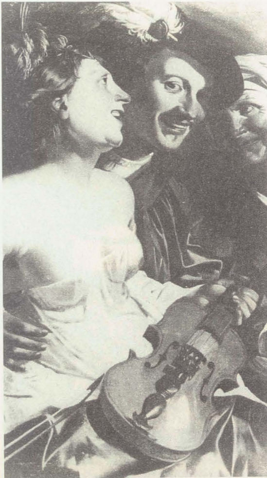
Abbildung 3: Dirck van Baburen, Der verlorene Sohn , 1623 (Ausschnitt)

ten Blick – sehr vornehmen bürgerlichen Kontext gezeigt. Eine Fülle kleiner, weniger auffälliger Details, die heute nur noch mit ausreichenden kunsthistorischen Kenntnissen interpretiert werden können, zeigt fast immer, dass der gesamte Inhalt mit der Bedeutung der Bordellszenen vergleichbar ist. Der Künstler zeigt die Frauen mit einem Musikinstrument oder singend, nicht weil er musizierende Frauen zeigen möchte, sondern weil der musikalische Kontext einen negativen oder moralisierenden Kommentar zum Benehmen dieser Frauen bietet.