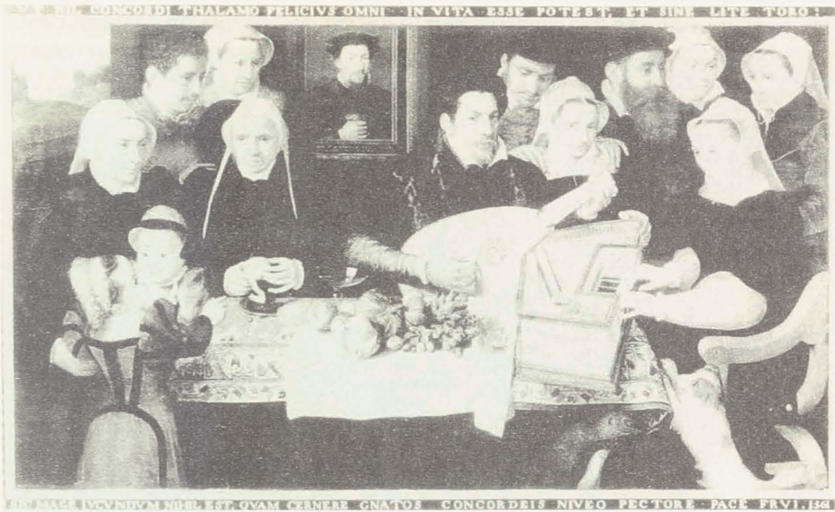
Abbildung 8: Frans Floris, Porträt der Familie van Berchem

hundert ist eine Familiengruppe von Gillis van Tilborgh im Brüsseler Museum voor Schone Kunsten (siehe Abbildung 9). 36 Ganz rechts ist ein junges Paar abgebildet. Der Mann steht neben der Frau am Cembalo. Charakteristisch für flämische Cembali aus der ersten Hälfte des 17. Jahrhunderts ist der an der Innenseite angebrachte Schmuck mit bedrucktem Papier, der oft mit moralisierenden oder religiösen Texten kombiniert wurde. 37 Hier liest man einen Text, der deutlich auf die ehelichen Tugenden anspielt: