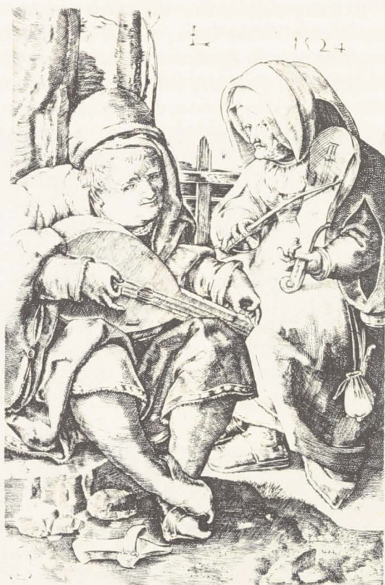
Abbildung 5: Lucas van Leyden, Musizierendes Paar , Holzschnitt 1524

das Gehör, auf die Erde, auf die Liebe, auf die Ehe, auf den Abend usw. Meistens spielt der Mann eine Laute, wobei er oft beim Stimmen gezeigt ist. Die Frau wird singend abgebildet, entweder ohne Musikinstrument oder mit einer Geige, was ein für Frauen ungebräuchliches Instrument mit vielen negativen, oft erotischen Bedeutungen war.