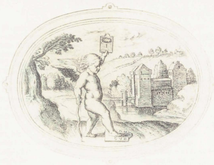
Abbildung 15: Otto van Veen (Vaeenius), Stich aus Amorum Emblemata , 1608

höchst selten eine Wiedergabe des realen Musiklebens. Die Bilder sind meist aus Elementen zusammengestellt, die an sich sehr realistisch aussehen, mit deren zugrundeliegendem Inhalt indes eine – meist moralisierende – Botschaft ausgedrückt wird.