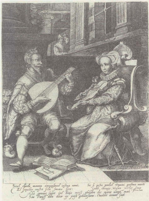
Abbildung 7: Musizierendes Paar , Stich von Gillis van Breen nach Cornelis Ysbranzoon Kussaens, Ende 16. Jahrhundert

All dies hat Sinn im Stich von van Leyden: Der junge Mann »besaitet« die Laute neben einer alten Frau mit einer »alten« Geige und mit einem gut gefüllten Geldbeutel, er lässt also seine Liebe kaufen.