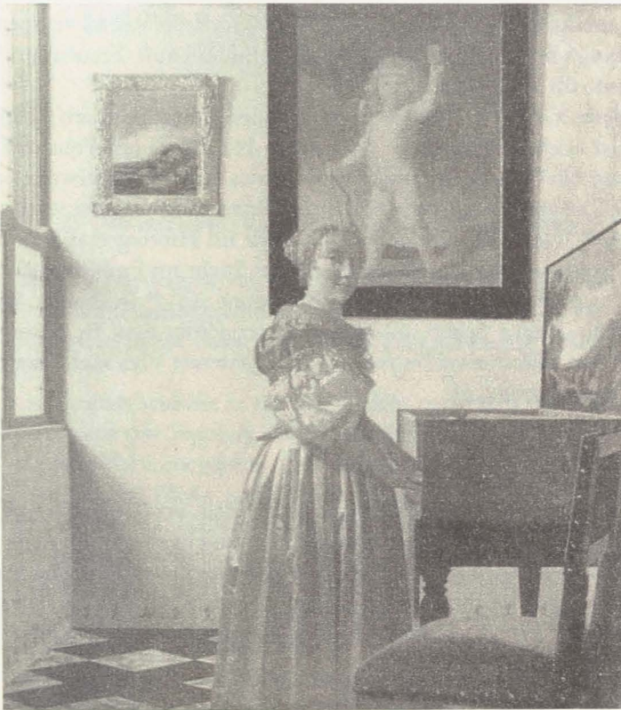
Abbildung 14: Johannes Vermeer, Junge Frau am Virginal , ca. 1670

Prasser und dem armen Lazarus, der Fall (siehe Abbildung 13). 45 Der Reiche sitzt in einem Zimmer und schaut bei verschiedenen Formen von Verführung und unzüchtigem Verhalten zu. Rechts im Vordergrund wird das Motiv musikalisch dargestellt: Die Dame sitzt am Virginal – dem Symbol für Tugend –, aber wendet sich einem Geiger zu – der Metapher für Unzucht. Der erotische Inhalt wird noch von Details im Hintergrund verdeutlicht. In einer Nische steht ein Venusbild mit Amor, und ein Mann hinter der Dame trägt eine Kerze – eine Anspielung auf das Heimliche, auf das, was nachts im Verborgenen passiert. Es ist also offensichtlich keine Darstellung eines Ensembles mit Virginal und Geige, das zum Tanz aufspielt, wie meistens gesagt wird.