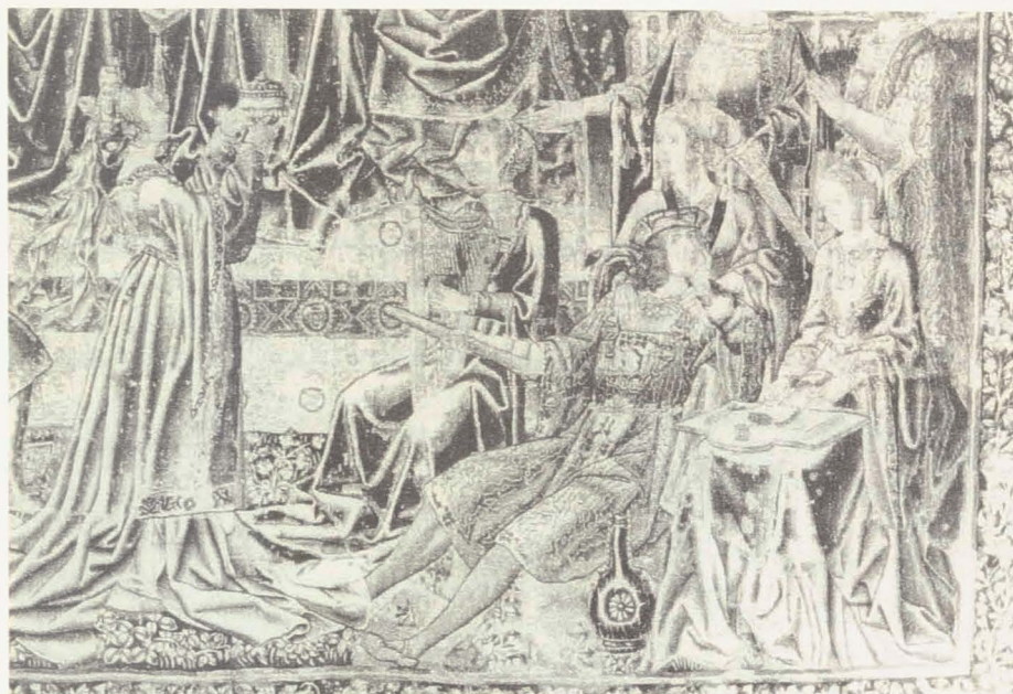
Abbildung 1: Wandteppich, Brüssel ca. 1520 (Ausschnitt)

das Fehlen einer Klaviatur das Hackbrett damals zum Gegenpol der besaiteten Clavierinstrumente machte – Clavierinstrumente, die vor allem mit weiblichen Tugenden identifiziert wurden. 7 Auch hier wird eine tugendhafte, allein musizierende Frau einer in Herrengesellschaft musizierenden Kurtisane gegenübergestellt.