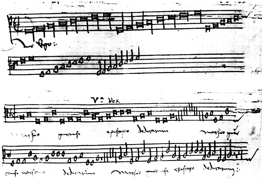
Abbildung 1: Motette »Ave mundi spes Maria«. Prima pars, Quinta vox. D-Bs Mus.ms. 3154, 464bis. Secunda pars, Quinta vox. D-Bs Mus.ms. 3154, 466bis.

30. März 1540) dediziert, und zwar in seiner Eigenschaft als Bischof von Gurk (in Kärnten), ein Amt, das Lang von 1505 bis 1522 bekleidete. Zumindest wird das im Text des Cantus firmus in der secunda pars des Werks erklärt. Und an diesem Cantus firmus setzte die eingangs erwähnte musikalische Beobachtung an. Abbildung 1 zeigt die beiden Cantus firmi der beiden Abschnitte des Werks, zusammen mit den Hexameter-Kanons für ihre Ausführung.