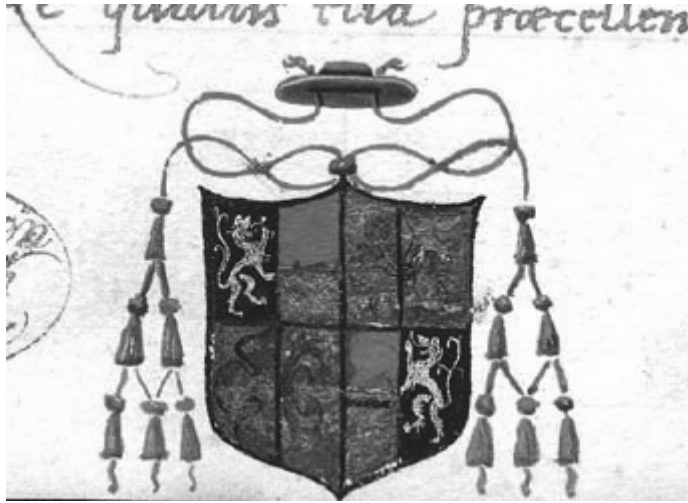
Abb. 3: Salzburger Wappen Matthäus Langs (nach: http://www.ubs.sbg.ac.at/sosa/einbaende/M1140wap.jpg )

Seine Ernennung zum Bischof von Gurk – sogar ohne die niederen Weihen genommen zu haben 23 – im Jahr 1505 und seine Erhebung in den Adelsstand zwei Jahre später erlaubten dem Bürgerlichen Lang, diplomatische Verhandlungen mit den höchsten europäischen Adelskreisen zu führen. Dies erklärt übrigens die mysteriösen Löwenfüße im ersten Kanon unserer Motette: Als Lang zu »Lang von Wellenburg« erhoben wurde, gab er sich ein Wappen, das zwei Löwen zeigt: 24