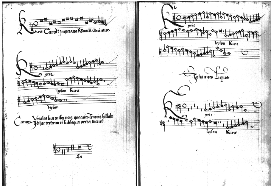
Lupus Hellinck, Missa Carolus Imperator Romanorum quintus, Kyrie I