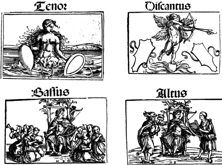
Abbildung 3: Hans Burgkmairs Titelblatt-Holzschnitte zu den Stimmbüchern in Erhart Öglins erstem Liederbuch (Augsburg 1512), in: Oeglin, Liederbuch (wie Anm. 57)

Konrad Peutinger, Maximilians unentbehrlicher ›Presseattaché‹ und Gründer der Sodalitas litteraria Augustana , gehörte. Zum weiteren Kreis rechnete auch Erhart Öglin. 53