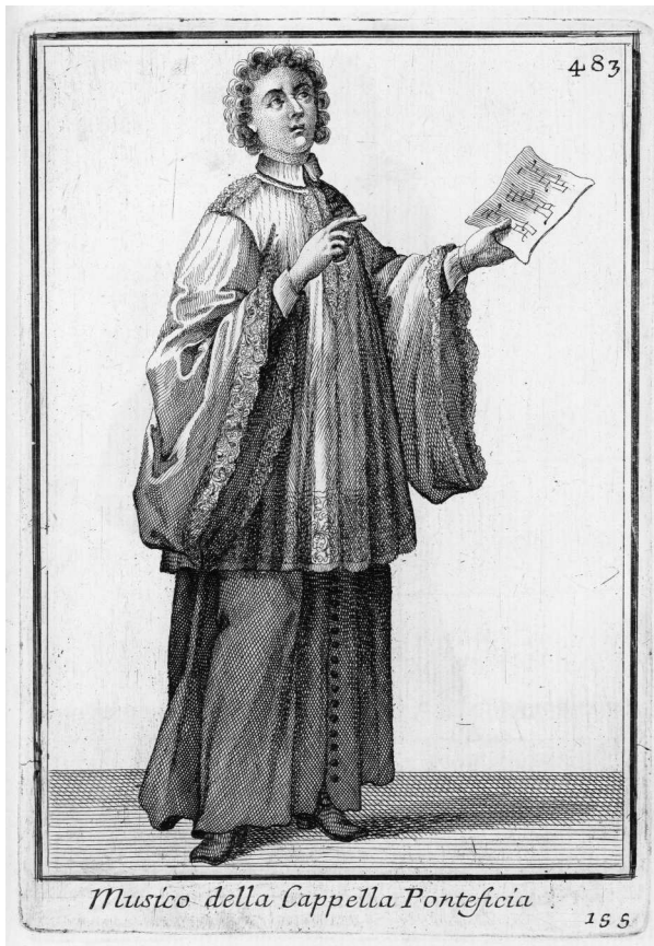
Abbildung 2: Filippo Bonanni, La Gerarchia Ecclesiastica ..., Rom 1720, Abb. Nr. 155 (bei S. 483)

stimmenden oder ablehnenden Kommentaren versah, was der Zeremoniar wiederum notierte. 127 Auch hier diente die Vokalmusik in erster Linie der Strukturierung von Elementen wie der Präsentation des Schweißstuches der Veronika und des Abschlusses der gesamten Feier. 128 Nimmt man nun noch