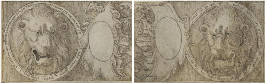
Abbildungen 7a/b: Maskarons und heraldische Leerstellen zu Beginn der Prima pars in Wien 2129 , fol. 2r; http://data.onb.ac.at/rep/1000D9B6 , © Bildarchiv/ÖNB

zählen.«) Es folgt im Maskaron unten rechts der Wahlspruch des Paracelsus: »Non fit alterius qui suus esse potest.« 62 (»Niemand sei eines anderen Knecht, der sein eigener Herr sein kann.«) Von den beiden Zitaten auf fol. 2r verweist das linke durch Quellenzusatz explizit auf Plutarchs Moralia : »Ut canes ovium custodes excubias agunt, non sibi timentes, sed ovibus: Ita rex non tam sibi debet timere quam populo.« (»So, wie die Hirtenhunde nicht um sich selbst, sondern um ihre Schafe besorgt sind, so muss ein König nicht so sehr um sich selbst, als um sein Volk besorgt sein.«) Und schließlich heißt es im Maskaron unten rechts: »Sol iucundissimus est iis, qui ipsum possunt intueri: Ita princeps quos, qui amant iusticiam.« (»Die Sonne ist für jene höchst angenehm, die sie anzuschauen vermögen; so auch ein Fürst für jene, welche die Gerechtigkeit lieben.«) Beide Zitate sind auch in einer einschlägigen Blütenlese des Erasmus von Rotterdam nachgewiesen, wo sie wohl nicht zufällig direkt übereinanderstehen. 63 Unser Chorbuch sollte demnach keinesfalls als Frucht eines ausschließlichen Bibli-zismus begriffen werden, wie bereits die weiter oben erwähnte Präsenz der Philosophen Demokrit und Heraklit unter den Sinnbildern der Tertia pars verrät.