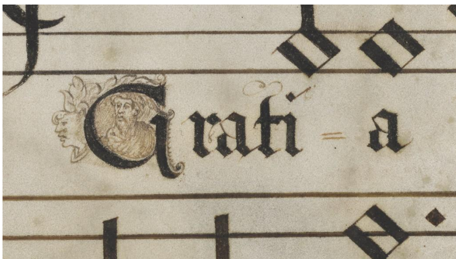
Abbildung 3: Bassus-Initiale (Kryptoporträt Richards von Genua?) in Wien 2129 , fol. 1v (Detail); http://data.onb.ac.at/rep/1000D9B6 , © Bildarchiv/ÖNB

Erstmals im Jahre 1563, letztmals 1574 erwähnt, aber wohl bereits zuvor verstorben, wirkte Richard am Münchner Hof als Bassist, Kopist sowie zeitweilig als Unterkapellmeister und Erzieher der Knaben. 20 Ob mit dem Brustbild eines bärtigen Mannes mittleren Alters in der »G«-Initiale des Bassus zu Beginn (siehe Abbildung 3) ein Kryptoporträt vorliegt – und damit eine weitere Form der auktorialen Einschreibung neben der Inschriftenbanderole sowie insgesamt vier Künstlersignaturen (»RG«) –, muss eine ebenso reizvolle wie letztlich unabweisbare Vermutung bleiben, zumal derlei Figureninitialen auch in anderen Quellen begegnen. 21 In Anbetracht seiner eigenen Stimmlage und dem Verzicht