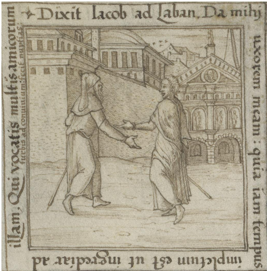
Abbildung 5: Jakob hält um Rahels Hand an. Einzelszene mit Inschrift (Gen 29,21) sowie zusätzlicher Textzeile, die Ausrichtung des Hochzeitsmahls betreffend (Gen 29,22) in Wien 2129 , fol. 6v (Detail); http://data.onb.ac.at/rep/1000D9B6 , © Bildarchiv/ÖNB

lud Laban alle Leute des Orts und machte ein Hochzeitsmahl«, Gen 29,22). Bei einem inhaltlichen Höhepunkt der Secunda pars versteht es Richard wiederum, durch Einschluss eines Chorbuchs mit Sängern – Begleitillustration zu der auf fol. 10v dargestellten Hochzeit von Tobias und Sara – auf den Ort von Gratia sola Dei im Rahmen der Münchner Fürstenhochzeit auch bildlich zu reflektieren.