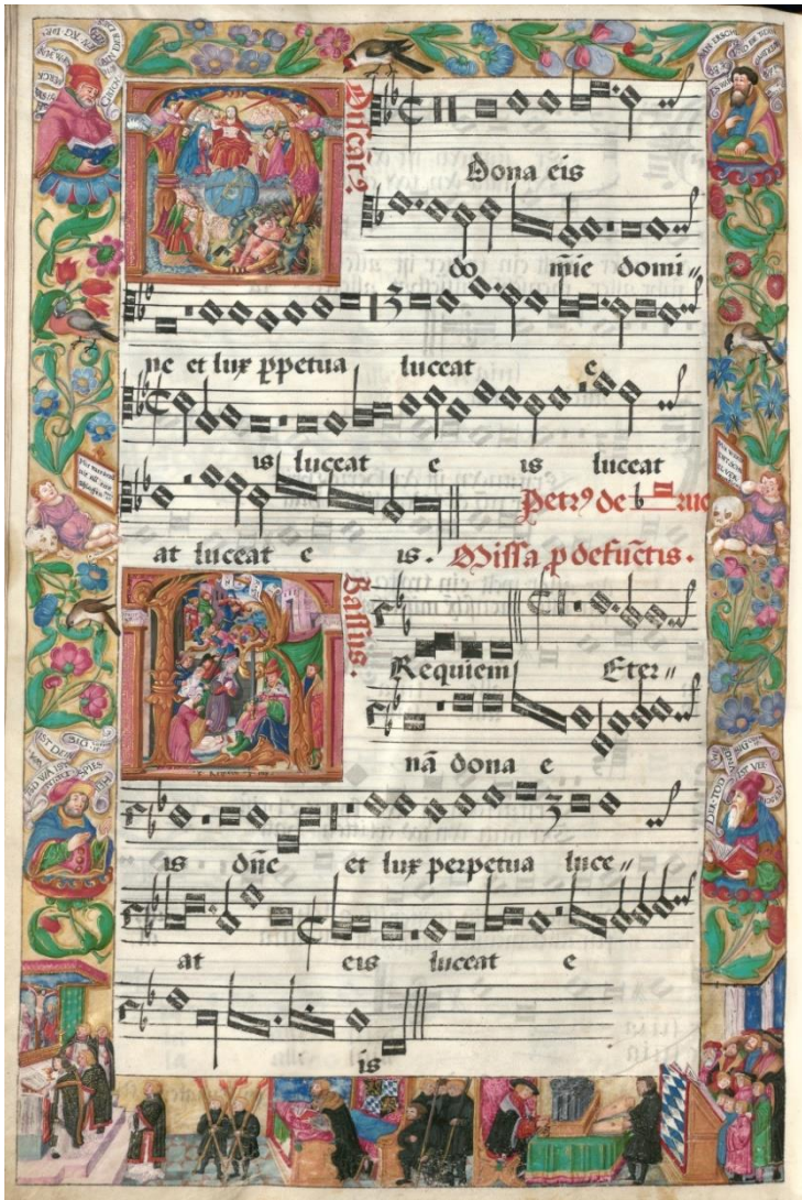
Abbildung 4: Eröffnungsseite zu Pierre de la Rue, Missa pro defunctis im »Ottheinrich-Chorbuch«.

bzw. fol. 14v/15r), die tugendhafte Susanna (fol. 123v; vgl. Wien 2129 , fol. 13v/14r), darüber hinaus beglaubigend-autoritative Motivbeigaben wie die vier Evangelistensymbole (fol. 144v/145r, vgl. Wien 2129 , fol. 9v/10r).