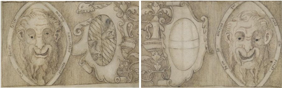
Abbildungen 6a/b: Maskarons und heraldische Beigaben (Wittelsbach, Österreich) zu Beginn der Prima pars in Wien 2129 , fol. 1v (Details)

an dritter Stelle vorgezogen, vermutlich um sie in der gewünschten typologischen Gegenüberstellung auf die Wirkungen des Heiligen Geistes beziehen zu können. Neben unverfänglichem humanistischem Expertenwissen (Jupiter »gamelius« als den Hochzeiten präsidierend; die Rolle der Juno »pronuba« als Brautführerin), das noch im frühen 18. Jahrhundert im »Lexikon kirchlicher Altertümer« des Zittauer Gymnasiallehrers Adam Erdmann Mirus unter dem Stichwort »copulatio« firmiert, 59 klingt speziell in Bezug auf den Heiligen Geist 60 die für Erasmus' Theologie des Ehesakraments fundamentale Auffassung an, wonach »das Empfangen der sakramentalen Gnade ... von der geistlichen Einstellung des Empfängers abhängig [ist]«. Speziell an dieser Positionierung und der im Umkehrschluss ableitbaren Möglichkeit zur Ehescheidung sollte das Tridentinum Anstoß nehmen. 61 Sollte es sich um pure Unbedachtheit im Umgang mit einem (leicht zugänglichen?) Text handeln oder erlauben die Zitate Rückschlüsse auf intellektuelle Freiräume innerhalb der wittelsbachischen Hofkapelle?