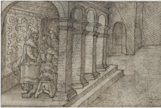
Abbildungen 2a-c: Einzelmotive zur Tobias-Erzählung in der Prachthandschrift von Orlando di Lasso, Gratia sola Dei (1568). Österreichische Nationalbibliothek, Mus.Hs. 2129 (= Wien 2129 ), fol. 10v (Details).

(a) Vorbereitungen zum Gastmahl; (b) Unterzeichnung des Ehevertrags; (c) Festmahl;