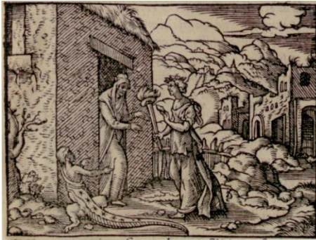
Abbildungen 3a/b: Einzelmotiv zur Tobias-Erzählung und zeitgenössische Vorlage. (a) Tobias' Mutter hält Ausschau nach ihrem Sohn. Wien 2129, fol. 11r (Ausschnitt); http://data.onb.ac.at/rep/1000D9B6, – (b) Ceres sucht ihre Tochter. Johannes Spreng und Virgil Solis, Metamorphoses Ovidii, Argvmentis... soluta oratione, Enarrationibus... & Allegorijs... accuratissimè expositae, Frankfurt am Main: Rab, Feyerabend & Han (Erben) 1563, Bg. I [1]r (fol. 65r).

lus, die für Albrecht V. offenbar wichtige Tobias-Thematik aufzugreifen, 40 zumal selbige sich für die Illustrationen einer Hochzeitsmotette wie Gratia sola Dei regelrecht angeboten haben dürfte.