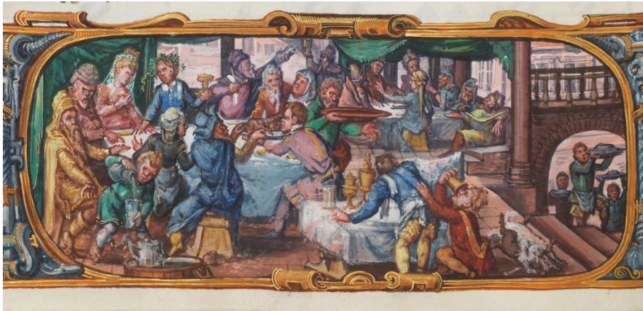
Abbildungen 1a/b: Illustrationen zu Cipriano de Rores Motette Benedictum est nomen tuum in Bayerische Staatsbibliothek München, Mus.ms. B(1. (a) Sara und der Dämon, S. 157 (Ausschnitt); (b) Hochzeitsmahl von Tobias und Sara, S. 158 (Ausschnitt); urn:nbn:de:bvb:12-bsb00103729-4, CC BY-NC-SA 4.0

nackte, wie eine Tizianische Venus auf dem Brautbett posierende Schönheit 27 noch für den männermordenden Dämon As(h)modäus, der gerade die »Nummer 7« aus dem Bett zerrt, dieweil sich die bereits zuvor ermordeten Ehemänner im Vordergrund der Anschlusszene regelrecht zu einem Fleischberg auftürmen. Stattdessen setzt er auf einen symbolischen Stellvertreter, wenn