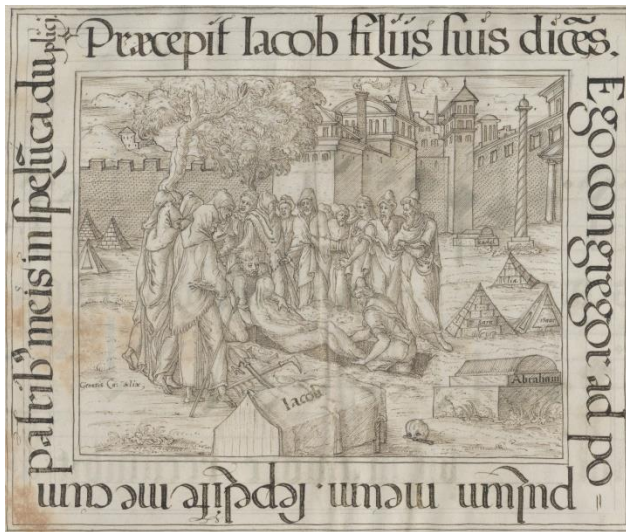
Abbildung 6: Hauptminiatur mit umlaufendem Titelus in Wien 2129 , fol. 8v (Jakobs Begräbnis); http://data.onb.ac.at/rep/1000D9B6 , © Bildarchiv/ÖNB

Noah und die Opferung Isaaks übernahm er als fast wörtliche Zitate desgleichen aus dem bereits genannten Figurenband zum Alten und Neuen Testament. 35 Wie beim Schöpfungsbild fand auch bei diesen zweien gleich die vorgefundene lateinische Inschrift Verwendung, wenngleich mit Abkürzungen, da weniger Platz zur Verfügung stand. Diese bequeme Strategie ließ sich allerdings nicht durchhalten, denn die drei Jakobsszenen, die in der Hochzeitsmotette folgen (fol. 4v, 5v und 6v), illustrierten Amman und Bocksberger nicht. Richard behalf sich mit einem in solchen Fällen bewährten Manöver: Er adaptierte andere Szenen für seine Zwecke. In eine Architektur, die Amman eigentlich für Daniel I entworfen hatte, fügte Richard die Rückkehr Esaus von der Jagd und den Isaakssegens (fol. 5v). 36 Die letzten beiden Szenen stimmen ikonographisch wieder mit ihren Vorlagen überein. 37 Dennoch verzichtete man hier nicht nur auf die Inschrift-