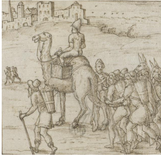
Abbildung 7: Bleistiftvorzeichnung in Wien 2129 , fol. 9r (Hinterlauf des Dromedars); http://data.onb.ac.at/rep/1000D9B6 , © Bildarchiv/ÖNB

ten, sondern setzte die Bilder mithilfe der umlaufenden, größeren Schrift deutlich von den anderen ab (siehe Abbildung 6). Möglicherweise diente der auffällige Wechsel der Vermeidung von Missverständnissen. Mit bzw. unter dem sechsten Bild enden die Verse der Prima pars . Eine rigide Beibehaltung des bisherigen Rahmensystems hätte wohl dazu geführt, dass Verse unter dem Bild fälschlich weiterhin als Fortführung des Motettentextes hätten gelesen werden können. Liegt hierin der Grund, so ist die Lösung deutlich, wenn auch wenig elegant.