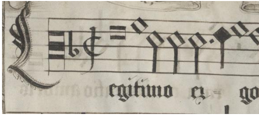
Abbildungen 3a/b: Unterschiedliche Lösungen für das Initium der Secunda pars in Wien 2129 : (a) fol. 10r (Altus); (b) fol. 9v (Tenor 1); http://data.onb.ac.at/rep/1000D9B6 , © Bildarchiv/ÖNB