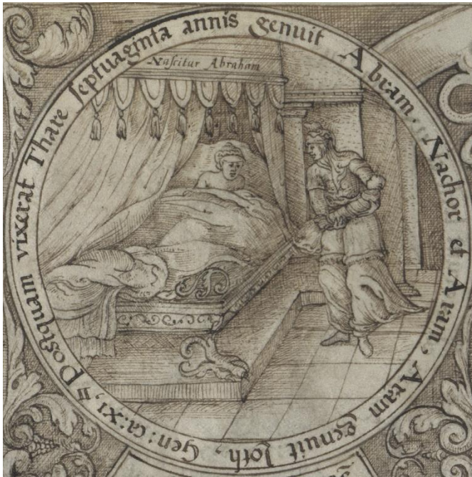
Abbildung 9: Geburt Abrahams in Wien 2129, fol. 3r (Detail); http://data.onb.ac.at/rep/1000D9B6