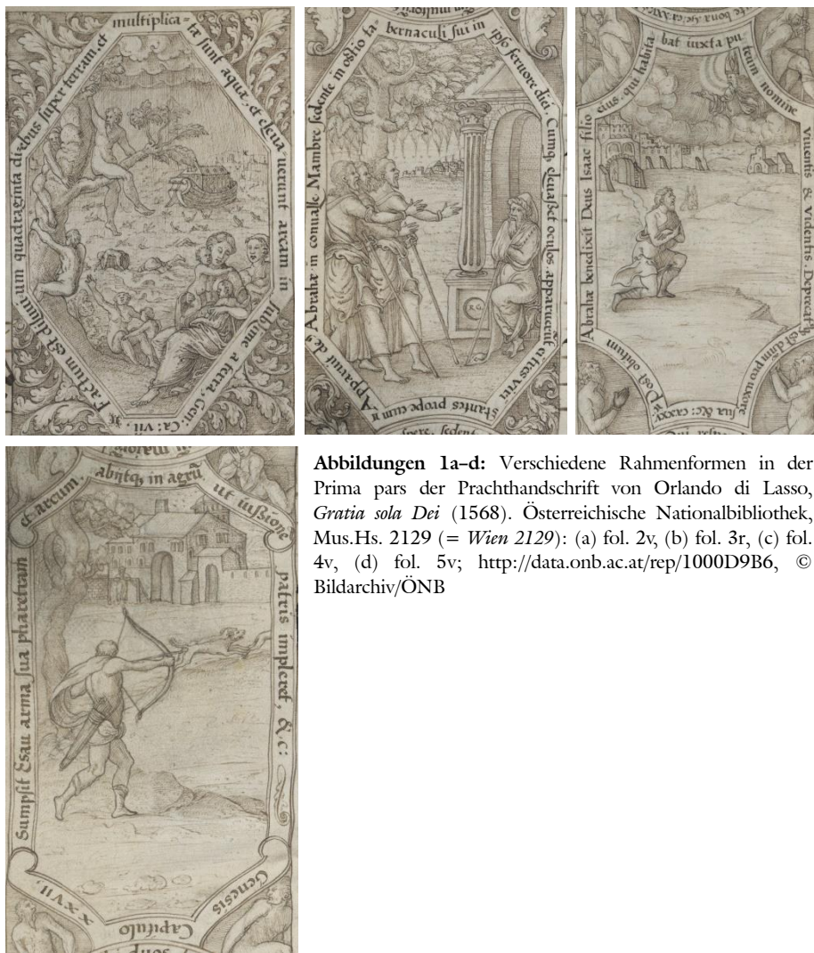
Abbildungen 1a–d: Verschiedene Rahmenformen in der Prima pars der Prachthandschrift von Orlando di Lasso, Gratia sola Dei (1568). Österreichische Nationalbibliothek, Mus.Hs. 2129 (= Wien 2129 ): (a) fol. 2v, (b) fol. 3r, (c) fol. 4v, (d) fol. 5v; http://data.onb.ac.at/rep/1000D9B6

gängig umlaufende Rahmung dieser Felder durch kleine Voluten (fol. 5r/v; siehe Abbildung 1d). Die Seite mit Jakobs Traum und Brautwerbung um Rahel ist die einzige, in der Quadrate und Ellipsen den Geschichten einen Rahmen geben (fol. 6r; siehe Abbildung 1e) – vielleicht sollte die Hochzeitsthematik hervorgehoben werden? Die weitere Geschichte Jakobs fügt sich auf den nächsten Seiten wiederum in Quadrate und eine neuerliche Variante der Rechteckrahmen (fol. 6v–7v; siehe Abbildung 1f), die dort, wo die Josephsgeschichte be-