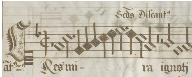
Abbildung 4: Redundante Stimmbezeichnungen zu Beginn der Tertia pars in Wien 2129 , fol. 12v (Cantus 2); http://data.onb.ac.at/rep/1000D9B6 , © Bildarchiv/ÖNB

Die Unterbringung einzelner Motettenverse als Paratexte bestätigt diesen Befund. In der Prima pars sind sie unterhalb der großen Historienbilder noch ganz gut aufgehoben (siehe S. 132, Abbildung 5a. 30 In der Secunda pars stehen Stoppios Verse einmal hier, einmal da – wie die Bibelparaphrasen und zusammen mit diesen, jedoch typographisch nicht von ihnen abgesetzt – in den Bildrahmen. 31 Eine Systematik, die dem Leser die Orientierung erleichtern würde, entwickelt Richard von Genua nicht. Schließlich die Tertia pars: Hier laufen die Motettenverse in Spruchbändern über die Seiten und werden auf der ersten Seite noch einmal in den Schriftrahmen wiederholt, wo sie allerdings nur bei genauerem Hinschauen auffindbar sind – etwa auf fol. 12v der Vers »Amplexus taedet longum expectare iugales« im Nebefeld der rechten Bordüre. 32 Da der Motettentext ja ohnehin unter den Noten steht, lag die Absicht dieser Wiederholung vielleicht darin, die Verse jeweils auch durchgängig, im ganzen Satz, lesbar zu machen. Elegant ist die Lösung nicht; ein geschickterer ›Layouter‹ hätte den Versen einen wiederkehrenden Ort und eine eigene Typographie zugewiesen. Übrigens bestand offenkundig kein Interesse daran, das Akrostichon, das die frisch Vermählten benennt, typographisch herauszustellen – oder geriet Richard von Genua hier an seine Grenzen?