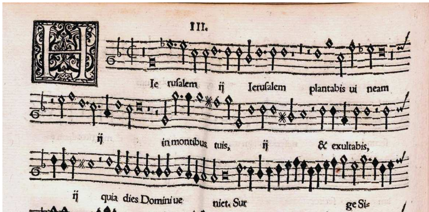
Imagen 2. München, Bayerische StaatsBibliothek, Digitale Sammlungen, 4 Mus.pr. 165#Beibd.1. Orlando di Lasso, Sacrae Cantiones quinque vocum (Nürnberg, 1562). Hierusalem plantabis vineam , inicio del discantus.