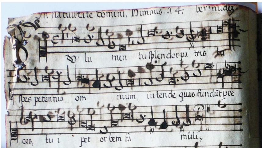
Imagen 3. AHAG, Cabildo, Música, Libro de polifonía 2-A, f. 3v. Tu lumen, Tu splendor Patris, segun-da estrofa del himno Christe redemptor omnium de Pedro Bermúdez, tiple.