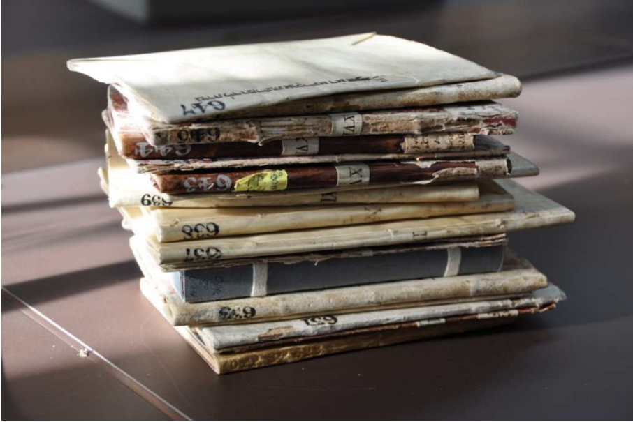
Abbildung 1: Altjiddische Lieddrucke der Bodleian Library, Oxford

vermutlich günstig zu erwerben. Druckzentren waren unter anderen Prag, Amsterdam, Frankfurt am Main, Fürth, Krakau, Offenbach, Frankfurt an der Oder und Venedig. Die Distribution konnte über den Drucker selbst, über Buchhändler, Reisende, Messebesucher und viele andere Wege erfolgen. Typisch war auch, dass diese Texte aus dem gedruckten zurück in den Manuskriptbereich liefen und per Hand kopiert und verbreitet wurden. 7